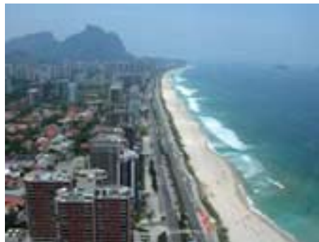
Barra da Tijuca