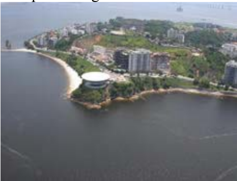
Niemeyer Museum in Niteroi

Museen gibt es in Rio de Janeiro unzählige. Am rechten Ende der Copacabana befindet sich das Militär-Museum Forte do Copacabana, oder in Niteroi steht das weltberühmte Niemeyer Museum, das einem UFO gleicht und schon für manche Werbespots als Kulisse benutzt wurde. In den lokalen Reisebüros lassen sich ausserdem Favela-Touren buchen, oder man kann bequem per Bus in die meisten Städte im umliegenden Brasilien reisen. Vom Busbahnhof fahren klimatisierte Überlandbusse nach Sao Paulo, Petropolis, Angra Dos Reis, Buzios, Brasilia und noch viele weitere Städte, zu einem sehr günstigen Preis. Allerdings empfehle ich Pullover, da es in den Bussen extrem kühl ist. Wer eine weiter entfernte Stadt in Brasilien besuchen möchte, der sollte einen Inlandflug buchen. Diese Flüge sind vor Ort ziemlich teuer, deshalb sollte man noch in Europa den sogenannten Brazil Air Pass buchen, mit dem man sogar bis zu 5 Städte anfliegen kann.