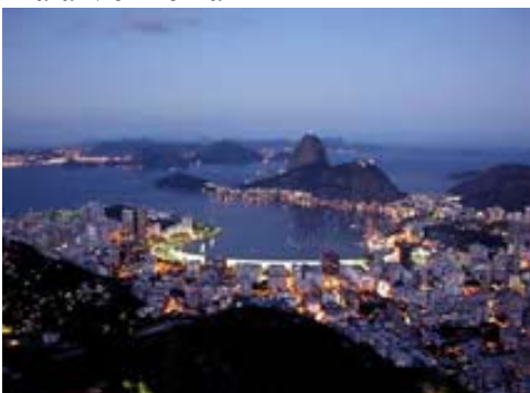
Aussicht vom Morrante Dona Marta nach Sonnenuntergang