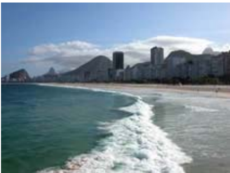
Aussicht vom Morro do Leme

So, und nachdem man diese wichtigen Infos nun weiss, kann man Rio endlich geniessen. Ab an den Strand an die vielen Strandbuden, wo ein Caipirinha oft nur 3.50 bis 5 Reais kostet (ab 1.75 Franken). Einen schönen Überblick über den Strand der Copacabana hat man vom Ende der Praia do Leme, vom Felsen Morro do Leme aus, wo die Fischer sind, oder vom anderen Ende, am Forte de Copacabana. Der Stadtteil Leme fängt beim Morro do Leme an und hört bereits an der Avenida Princesa Isabel auf (Hotel Le Meridien). Von dort an beginnt die 4 km lange Praia de Copacabana, an dessen Ende das Militärmuseum Forte de Copacabana auf einem Felsen steht. Der Eintritt in dieses Museum kostet 4 Reais. Nebst dem Museumsbesuch geniessst man einen traumhaften Blick über die Copacabana, und ein sehr gutes Restaurant mit toller Aussicht lädt zum Bier trinken oder Mampfen ein.