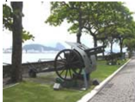
Forte de Copacabana

Gleich hinter dem Museum befindet sich der kleine Strand von Arpoador. Nach Arpoador empfiehlt sich unbedingt ein Spaziergang auf den Felsen beim Parque Garota de Ipanema, von wo aus man eine atemberaubende Aussicht über Arpoador, Ipanema und Leblon geniessst. An der Praia de Ipanema gibt es einen kleinen Zulauf (Mündung), der in die Lagoa Rodrigo de Freitas führt. Dieser Zulauf trennt die Praia de Ipanema von der Praia de Leblon. Am Ende der Praia de Leblon, entlang der Avenida Niemeyer, sollte man unbedingt die paar Meter den Hügel hoch spazieren oder radeln, damit man die fantastische Aussicht über Leblon und Ipanema geniessen kann.