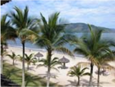
Hotel Portobello, Mangaratiba

Wo wir uns gerade auf dieser Strasse befinden, gelangt man hier weiter nach Itacuruca, Mangaratiba oder Angra Dos Reis. Wer eine Reise nach Angra Dos Reis plant, sollte jedoch in Rio zur Busstation Rodoviaria Novo Rio fahren und von dort aus für ein paar Franken in den Überlandbus steigen. Diese sind komfortabler und vor allem schneller. Mit den gewöhnlichen Bussen kann ein Ausflug in das 150 km entfernte Angra locker zu einer Tagesreise werden. Von Angra Dos Reis aus gibt es Ausflüge auf die Ilha Grande. Wer einen längeren Aufenthalt in Rio hat, dem empfehle ich unbedingt einen Ausflug an die Costa Verde, nach Angra Dos Reis und die Ilha Grande. Es ist das Paradies.