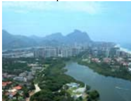
Helikopterflug, Barra da Tijuca

Eine der schönsten Promenaden zum Spazieren gehen ist der Stadtteil Botafogo, von wo aus man den weltberühmten Blick auf den Zuckerhut hat, der hier im richtigen Winkel steht. Das Wasser allerdings stinkt fürchterlich, und der hübsche Strand mit der schönsten Aussicht ist immer menschenleer, mit Ausnahme von einigen Fussball-Spielern... Von Botafogo aus sind es nur ein paar Gehminuten bis zum Stadtteil Flamengo mit dem gleichnamigen Strand, wo das Baden allerdings auch nicht zu empfehlen ist aufgrund der miserablen Wasserqualität. Das Baden an Rios Stränden wird nur ab der Copacabana empfohlen. Früher war auch das Wasser an der Copa zum Baden nicht geeignet, da an einigen Stellen Abwasser heraus floss. Heute wurden diese Abwasserkanäle aber still gelegt, und die Wasserqualität hat sich wieder stark gebessert. Alle Strände nördlich der Copacabana (Richtung Zuckerhut) sind auf keinen Fall zu empfehlen, da die Guanabara Bucht, so schön der Name auch klingt, nur aus einer stinkenden Jauche besteht.