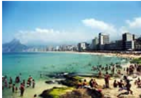
Praia de Ipanema

Wer auf der Avenida Niemeyer weiterfährt und das Hotel Sheraton passiert hat, streift den Eingang zur Favela Rocinha, der grössten Favela Brasiliens, man sagt sogar, der grössten weltweit, mit an die 300'000 Einwohner. Rocinha kann man besuchen. Die Favelados verfügen über Strom und Wasser, Schulen, sogar eine eigene Bank und die Gegend wird teilweise sehr sauber gehalten.