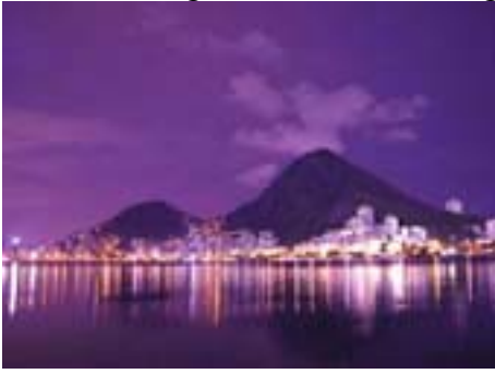
Aussicht von den Kiosk-Restaurants über die Lagoa

manchmal das Beste. Oder freundlich „Nein Danke“ sagen und sich dann nicht mehr weiter auf ein Gespräch einlassen. Tagsüber ist es fast ruhiger als abends.