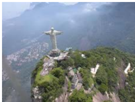
Corcovado, fotografiert vom Helikopter Rundflug