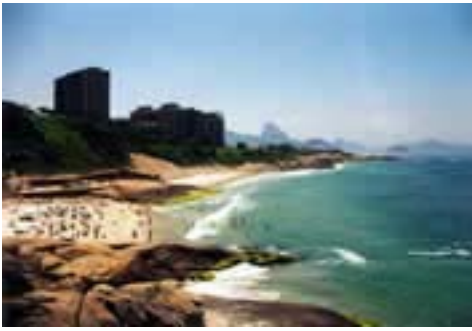
Praia do Arpoador