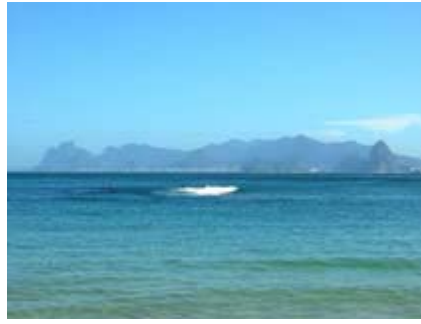
Strand in Itaipu nördlich von Niteroi, wunderbar klares, ruhiges Wasser und super Aussicht auf Rio