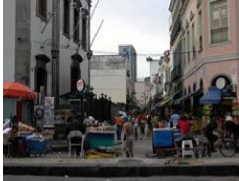
Einkaufsstrassen im Historischen Teil Rios

Rund um Rio befindet sich der Floresta da Tijuca, der einzige Stadt-Regenwald der Welt. Wer sich hier hinein begibt, hat das Gefühl, man befinde sich im Amazonas. Nur wenige Kilometer trennen den Wald von der Stadt, und doch ist es hier oben ziemlich kühl und feucht, oftmals auch bewölkt, während über der Stadt Hitze und purer Sonnenschein herrscht. Ganz in der Nähe liegt auch der Botanische Garten, mit seinen unzähligen Palmenarten, Exotischen Pflanzen, Vögeln und Orchideen.