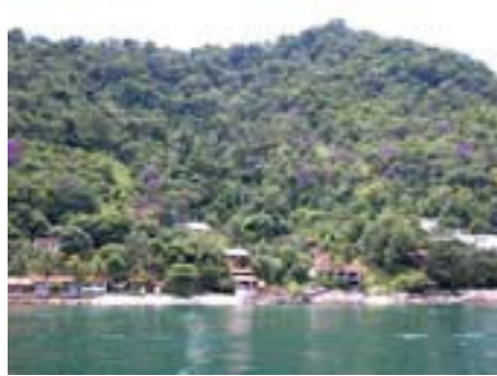
Angra Dos Reis