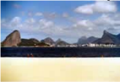
Aussicht auf Niteroi auf Rio

Ein Erlebnis in Rio ist ebenfalls, mit der uralten Santa Teresa Bahn zu fahren. Die Fahrt ist praktisch geschenkt (kostet unter 1 Franken), bietet einem aber die wohl unglaublichste Holperfahrt inmitten lebenslustiger Cariocas, durch wunderschöne, steile Strassen hinauf ins Viertel Santa Teresa. Die Bahnstation befindet sich in Downtown Rio, gleich neben der berühmten Kathedrale Metropolitana.