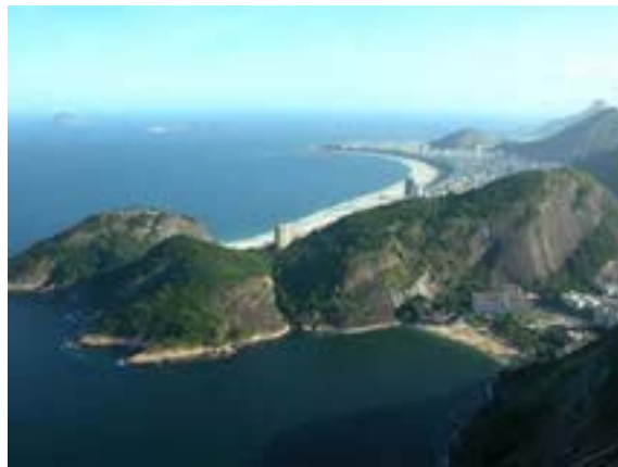
Aussicht vom Zuckerhut auf die Copacabana